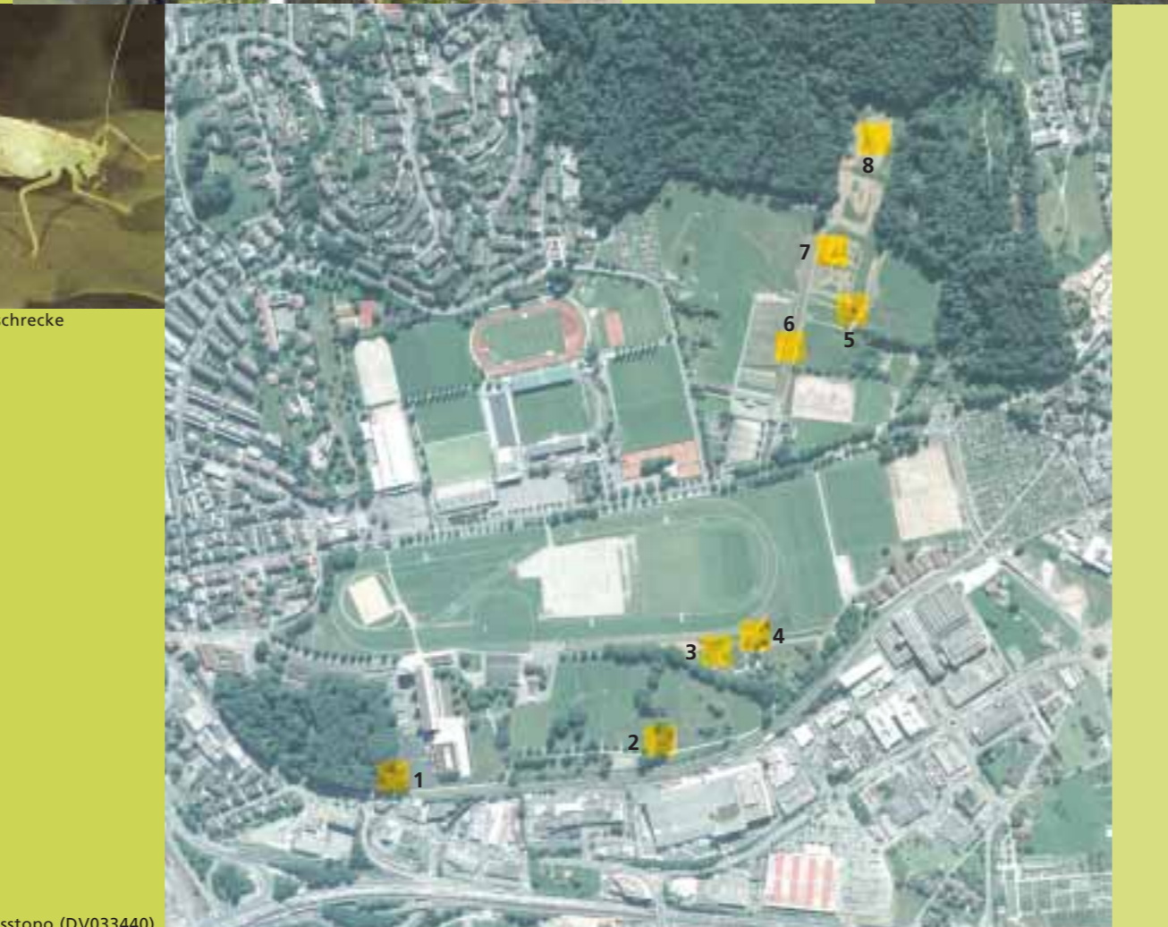
Luftbild © swisstopo (DV033440)